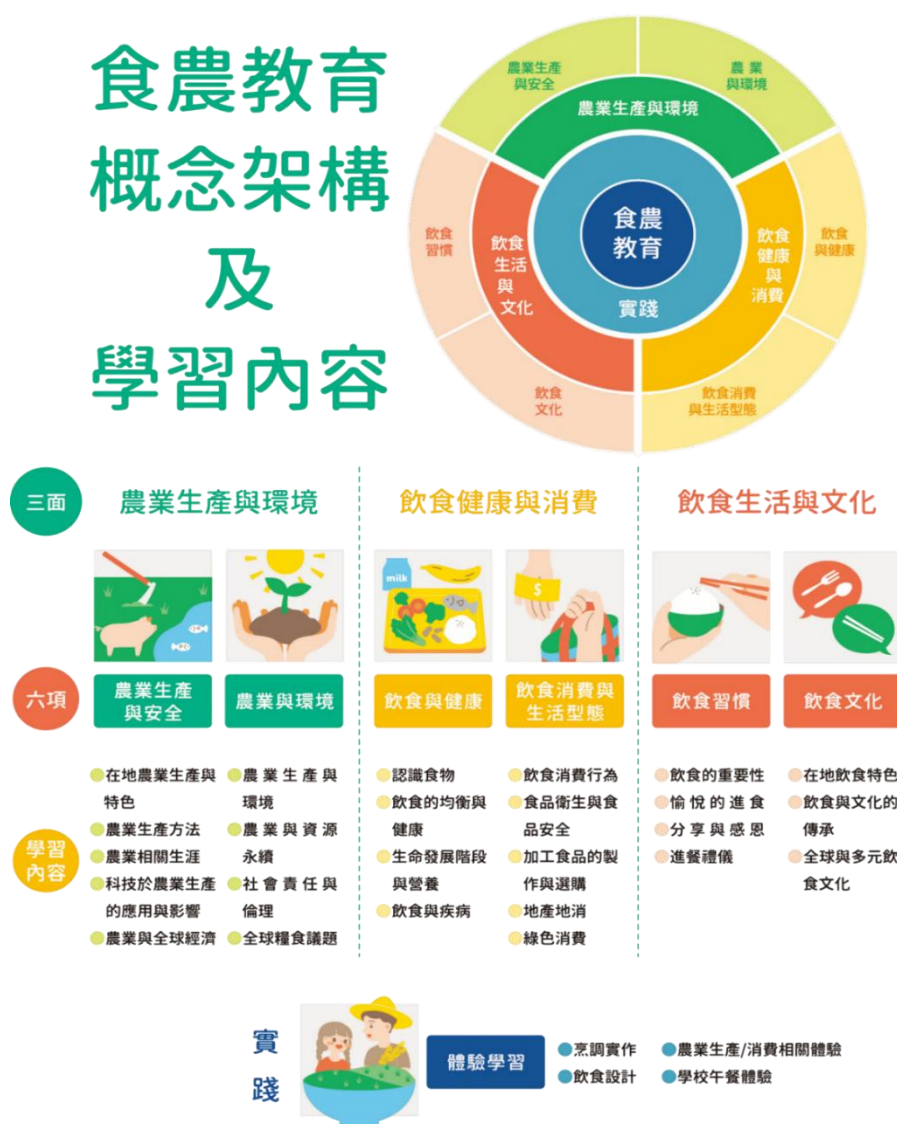
圖 1 食農教育 ABC 模式：食農教育三面六項